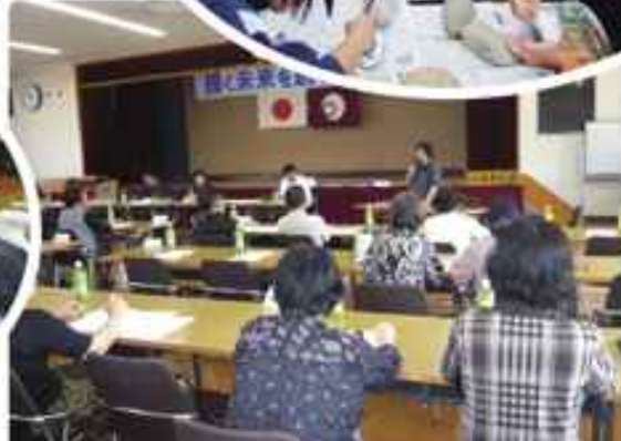
▲リーダー情報交換会